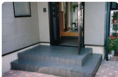
玄関タイルの汚れのお悩み解決します